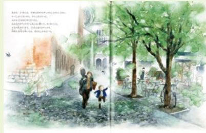
いせひでこ「チェロの木」(偕成社刊)より

朗読「チェロの木」 作・絵:いせひでこ 森の木を育てていた祖父、楽器職人の父、そして音楽にめざめる少年。おおきな季節めぐりの中でつらくなっていくいのちの詩。いせひでこの描く絵本の世界とチェロが奏でる音楽、そして柔らかな響きの朗読に手話と映像を交えてお贈りします。